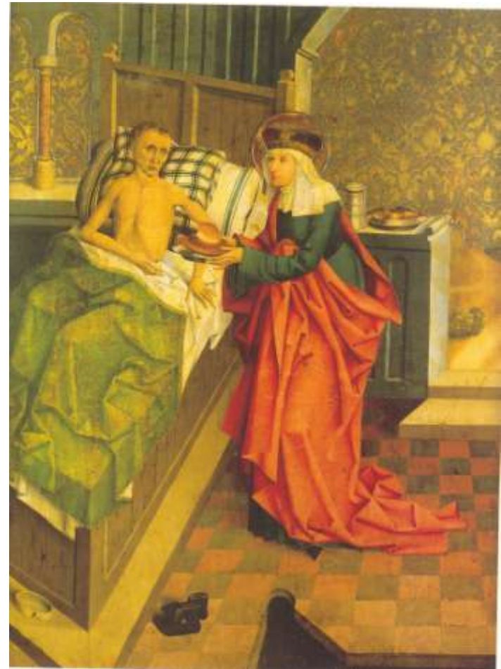
Sv. Anežka Česká